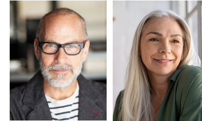
Postmaterielles Milieu Engagiert-souveräne Bildungselite mit postmateriellen Wurzeln