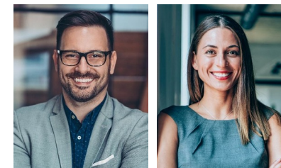
Milieu der Performer Die effizienzorientierte und fortschrittsoptimistische Leistungselite